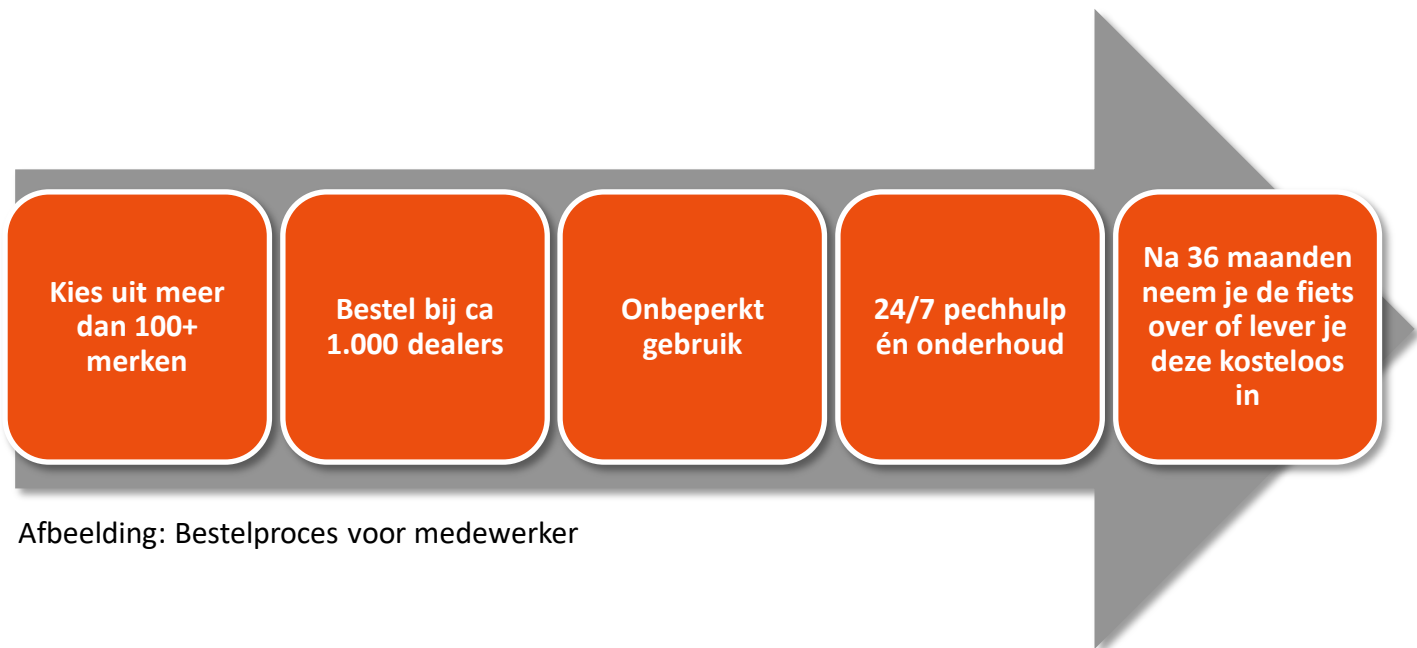
Afbeelding: Bestelproces voor medewerker